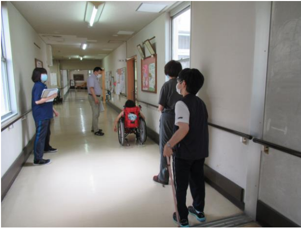
廊下からソーシャルディスタンスで、利用者を食堂に誘導