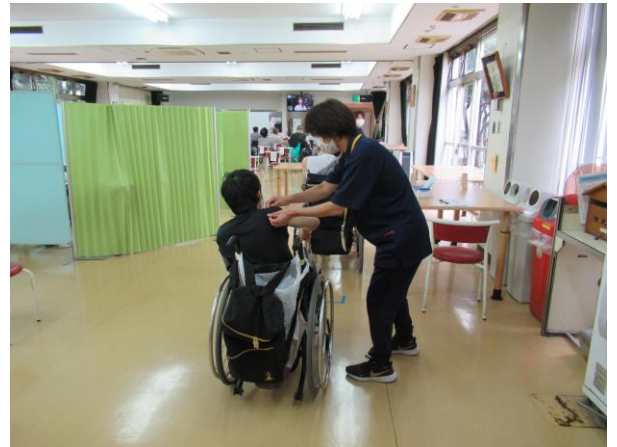
接種がスムーズにできるように、利用者には半袖着用をお願いし、腕まくりを職員が支援した