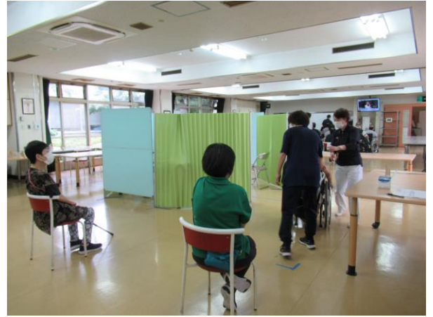
待機所は前回より少人数にして、一人一人チェックしながら確実に誘導した