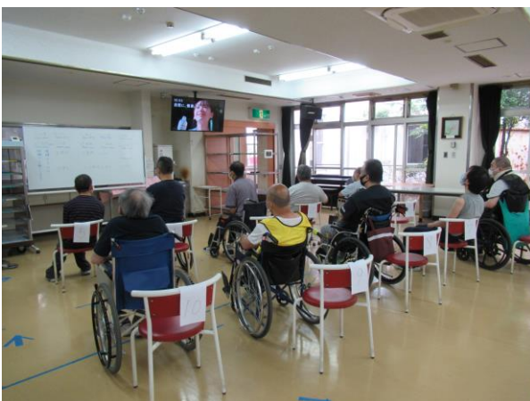
様子観察所では各自テレビを見ながらゆっくりとくつろいでいただいた