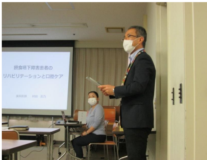
副園長のあいさつ

件名(題名)「令和2年度 摂食嚥下講習会 開催」 実施日： 11月 25日 (水)