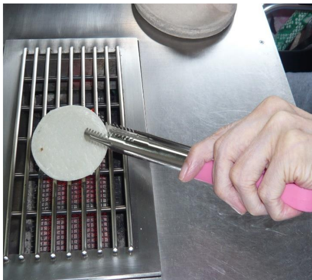
5秒ごとにひっくり返します。

暑い日々が続きますが、久しぶりに草加せんべい焼き体験に行ってきました。 せんべい焼きはテンポよくひっくり返すところが難しそうでしたが、皆さんうまく焼けました。