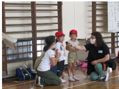
年長さんの『かいかいのことば』