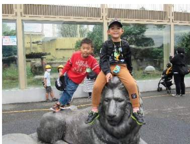
← 獣コーナーで5才児さん

子どもたちは、しおりを片手に動物さん探しです。 「あ、いたいた」「あっちだよ」元気に走り出しました。 動物を見つけると、一緒に配られたシールを貼ります。 カレンダーワークで慣れた子どもたち、上手に貼れました。