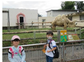
ラクダの前でツーショット

お昼前に集合し、解散しました。その後昼食を食べ遊園地コーナーへ行ったお友だちも多かったようです。楽しい一日でした。参加された皆様、お疲れさまでした。